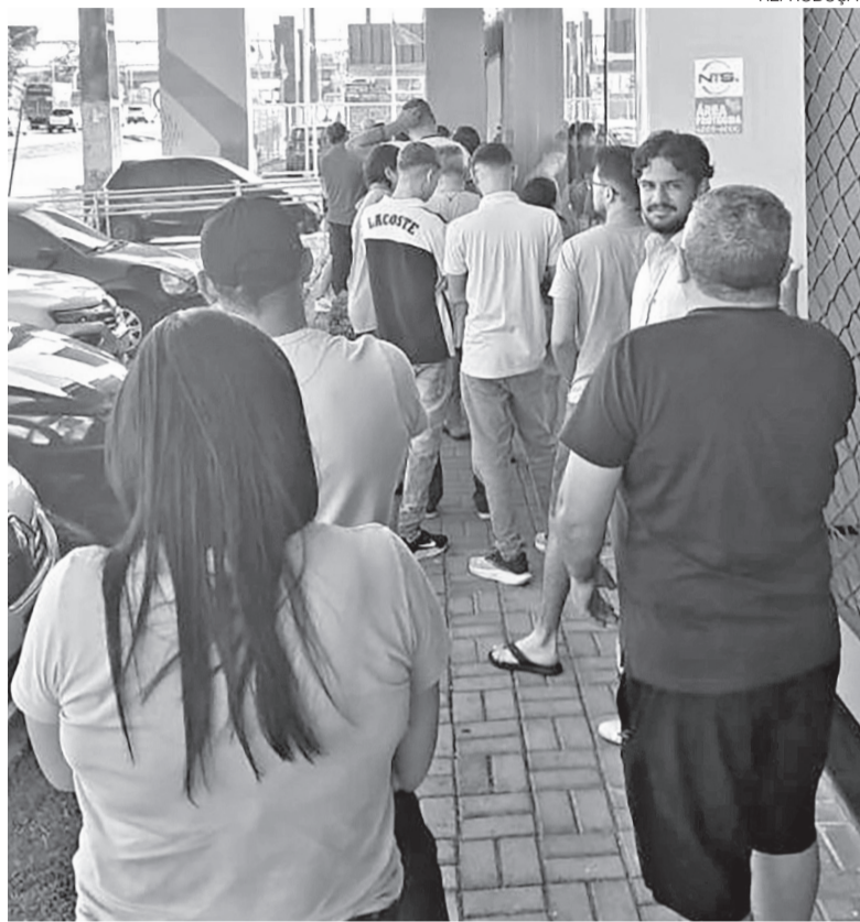
Motoristas de aplicativo aguardam em fila em Natal para tentar comprar carro

Schuber afirma que parte dos interessados sequer demonstrava preferência por um modelo específico e buscava apenas testar a aprovação junto aos bancos. Após conseguir o crédito, muitos passaram a negociar preços entre diferentes marcas. O diretor também avalia que o elevado volume de atendimentos acabou reduzindo a atenção dedicada aos