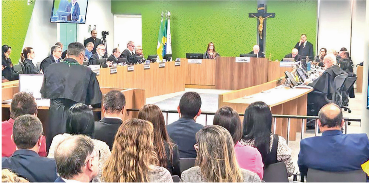
Tribunal Pleno do Tribunal de Justiça do Rio Grande do Norte durante sessão administrativa nesta quarta-feira 1ª