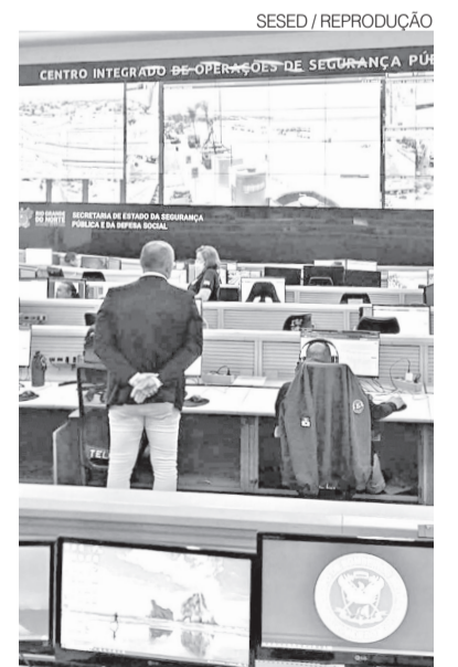
Central de monitoramento em Natal

Outro objetivo da nova plataforma é ampliar a qualidade das informações utilizadas no planejamento das ações de segurança pública. O sistema aprimora a produção de dados estatísticos da Coordenadoria de Informações Estatísticas e Análises Criminais (COINE), permitindo análi-