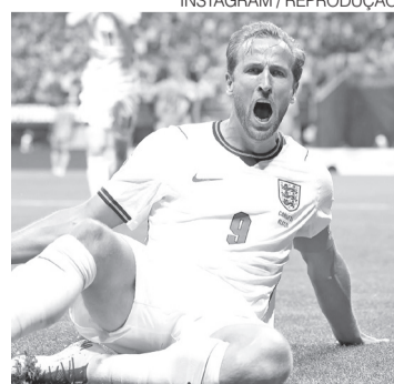
Kane tem 84 gols pela Inglaterra

A Inglaterra volta a campo no próximo domingo, 5, pelas oitavas de final, contra o México. No mesmo dia, o Brasil enfrentará a Noruega. ●