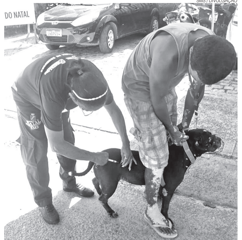
Devem ser vacinados na campanha cães e gatos saudáveis a partir de três meses de idade