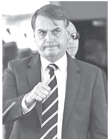
Ex-presidente foi condenado e está preso