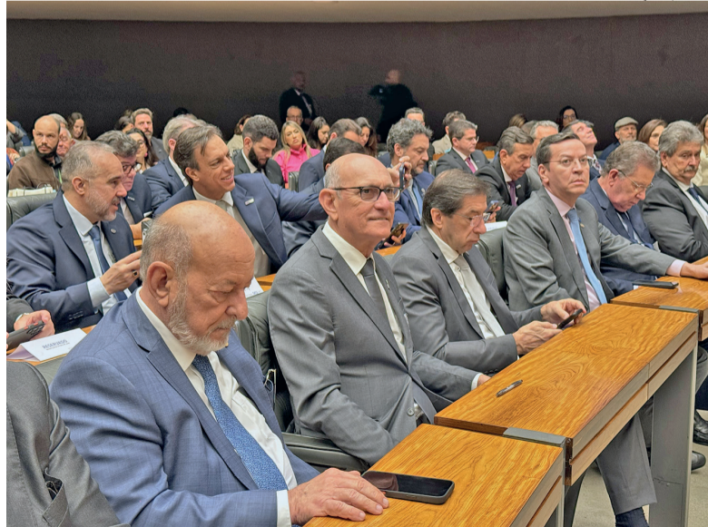
Sessão reuniu lideranças da indústria para destacar o papel do SESI no RN