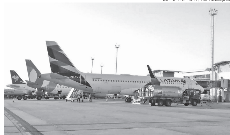
QAV é um dos principais componentes dos custos das companhias aéreas

Em nota, a Petrobras destacou que o mercado brasileiro de QAV