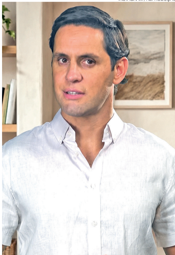
Ex-deputado Rafael Motta é pré-candidato ao Senado

A declaração representa uma nova manifestação pública do