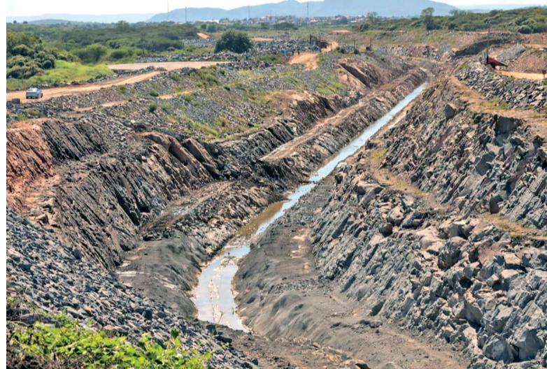
Ramal do Apodi compõe transposição do São Francisco e beneficiará 750 mil

Luiz Inácio Lula da Silva Presidente da República