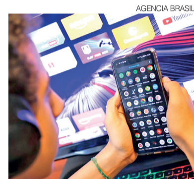
Internet chega a 94% dos lares do RN

A pesquisa também evidencia diferenças de renda: nos domicílios sem computador e sem tablet, o rendimento domiciliar per capita era, em média, de R$ 1.068. Já nas residências com pelo menos um