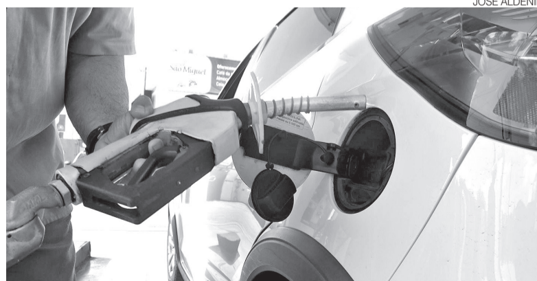
Na refinaria, que fica em Guamaré, a gasolina ficou R$ 0,05 mais e o diesel R$ 0,06

Na semana anterior, o diesel havia acumulado uma redução de R$ 0,13 por litro. Na modalidade EXA, o preço caiu de R$ 4,48 para R$ 4,35,