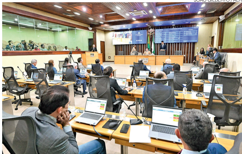
Plenário da Assembleia Legislativa do RN em sessão nesta quinta-feira 2

A plataforma deverá disponibilizar dados como o número da emenda, o nome do parlamentar autor, o valor destinado, o objeto financiado, o município ou entidade beneficiada, a origem dos