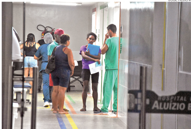
Grande Natal respondeu por 87,2% das internações registradas no Estado

Considerando os números apresentados pelo DataSUS, a Região Metropolitana soma 163 internações, resultado da soma dos 129 registros de 2025 e dos 34 registrados até abril de 2026.