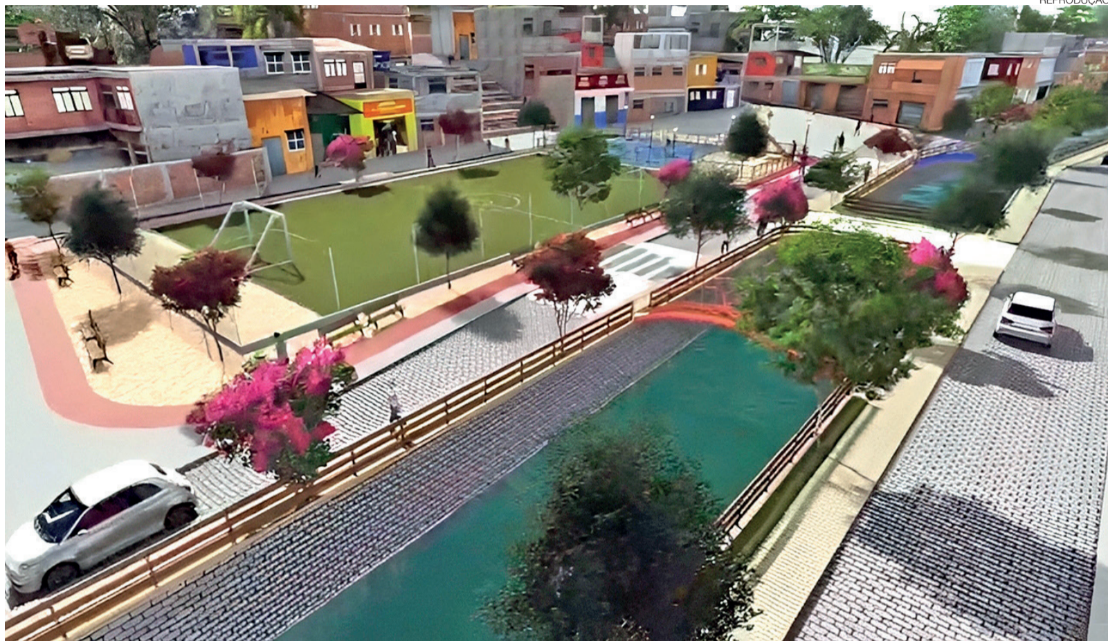
Maquete do projeto mostra como ficará o Canal das Lavadeiras após a reconstrução e urbanização, obra de R$ 19 milhões que prevê estrutura de drenagem

Os serviços serão executados na modalidade de contratação integrada, em que a empresa vencedora ficará responsável pela elaboração dos projetos executivos e pela execução da obra. O prazo total é de 12 meses, sendo os dois primeiros destinados aos projetos, sondagens e terraplanagem,