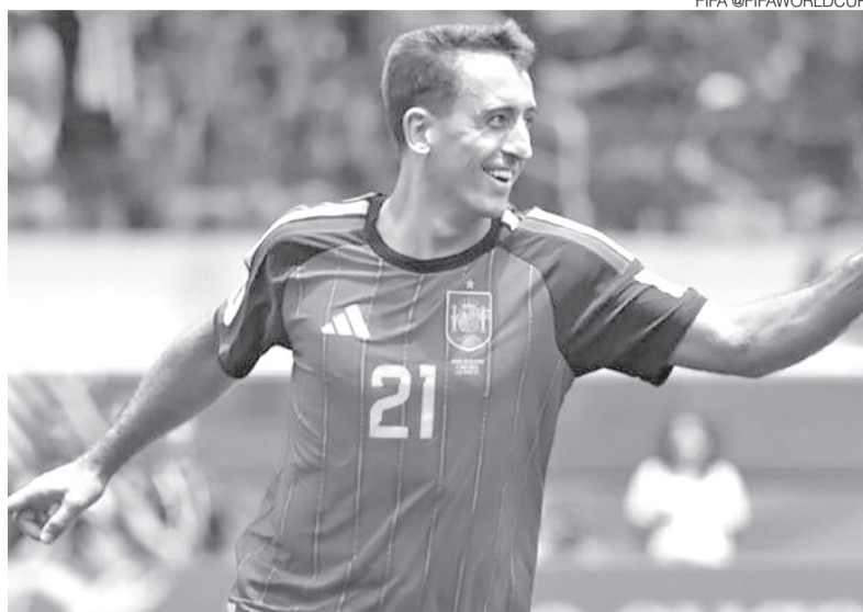
Oyarzabal comemorando um dos dois gols que fez contra a Áustria

No primeiro tempo, Oyarzabal e Yamal tiveram chances,