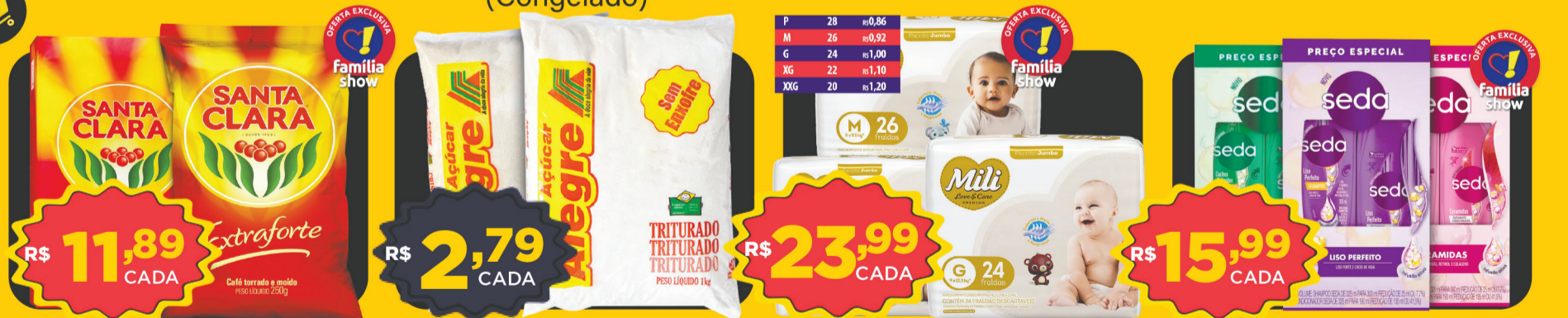
R$ 11,89 CADA Café Santa Clara 250g (Extraforte - Almofada/A Vácuo)