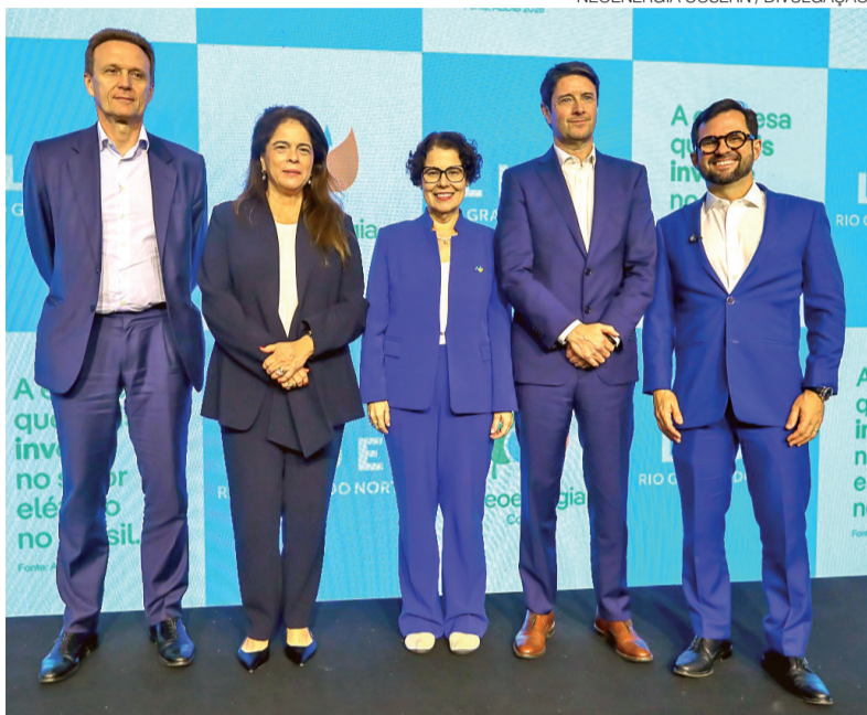
Executivos da Neoenergia Cosern durante almoço com empresários ontem

Do total previsto, 37,36% dos recursos serão destinados à expansão da infraestrutura elétrica, 26,43% à modernização, digitalização e melhoria da rede e 36,21% ao combate às perdas de energia e ao fortalecimento da infraestrutura operacional, incluindo tec-