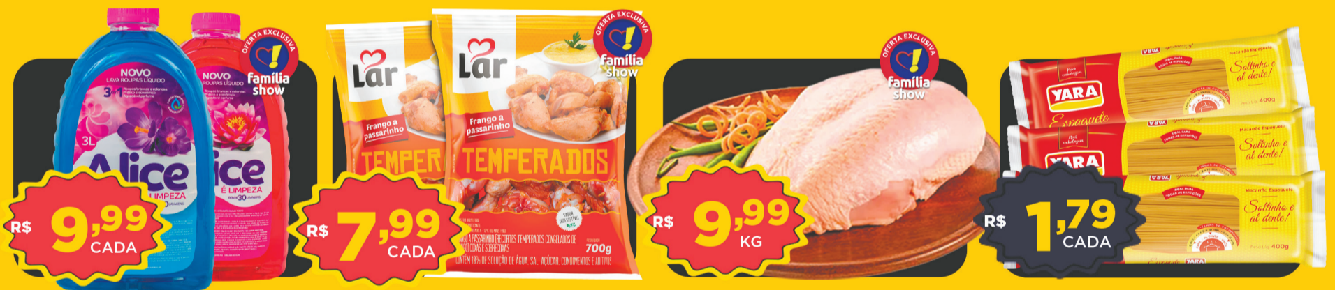
R$ 9,99 CADA Lava Roupas Líquido Alice 3L (Fragrâncias)