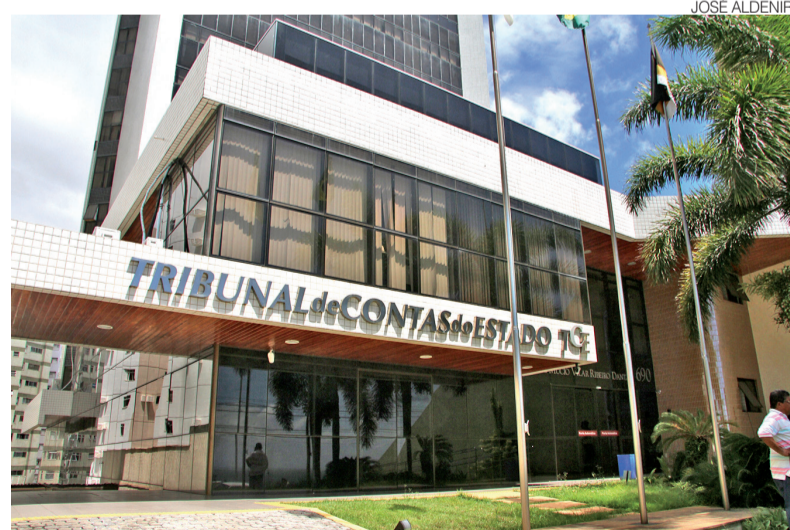
Impacto previsto para 2026 supera R$ 2 milhões, segundo estudo do TCE

Nos cargos em comissão, a remuneração total variará de R$ 3.561,93, no símbolo CC-5, até R$ 19.020,12, no CC-1, faixa