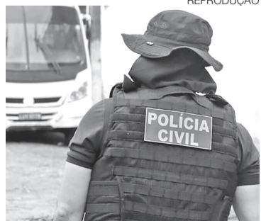
PC desbarata esquema milionário