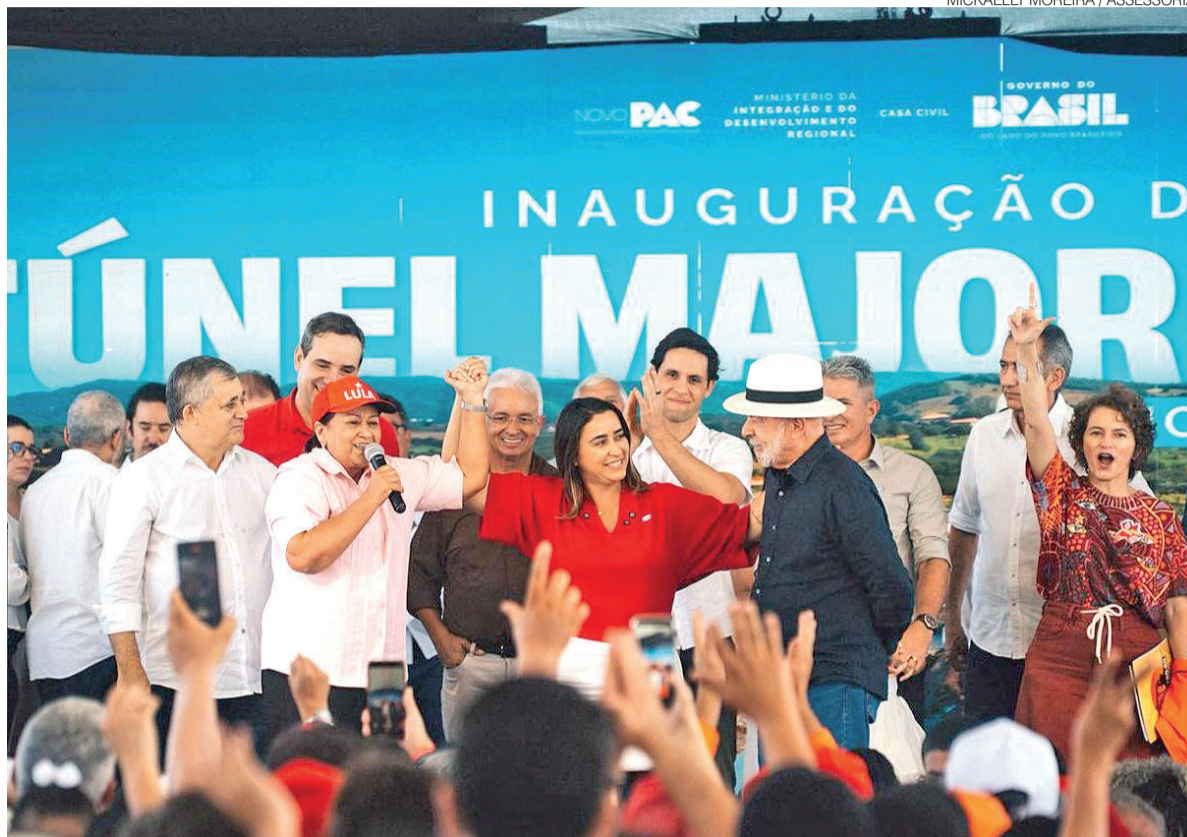
Palco montado para cerimônia de inauguração do Túnel Major Sales, no Ramal Apodi, em Luís Gomes, no Oeste potiguar

Interlocutores do PT afirmam que o presidente fez uma brincadeira e evitou citar o nome de