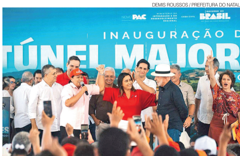
DEMIS ROUSSOS / PREFEITURA DO NATAL

recer, a entidade aponta possíveis inconstitucionalidades e dispositivos que, em sua avaliação, podem ampliar a insegurança jurídica, aumentar a burocracia dos licenciamentos ambientais e reduzir a competitividade do Estado.