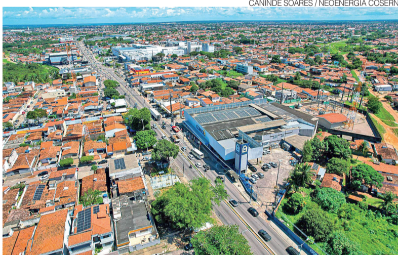
Zona Norte será contemplada com nova linha de transmissão de energia

nologia da informação, sistemas e frota. Entre os destaques, está a construção de uma nova linha de transmissão para a Zona Norte de Natal e redes subterrâneas em Natal (Ponta Negra), Mossoró e Tibau do Sul (Praia de Pipa).