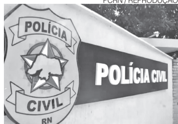
Homem está preso na delegacia