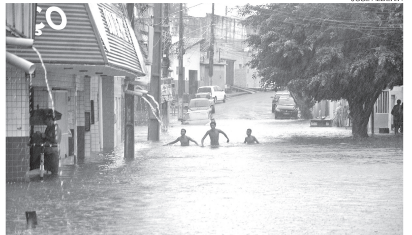
Rua Ver. Cauby Barroca, nas Rocas, registrou alagamento em abril e maio

O volume de precipitações exigiu atuação contínua de diferentes órgãos municipais ao longo do semestre. Entre as medidas adotadas estiveram serviços de limpeza da rede de drenagem, monitoramento de áreas suscetíveis a alagamentos, operação de bombas, vistorias preventivas e atendimento a ocorrências rela-