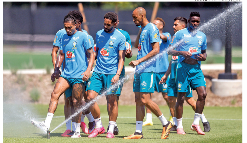
Seleção treinou firme e Ancelotti fez testes com Danilo Santos e Martinelli

Durante a atividade de quinta-feira 2, o treinador ainda testou outra alternativa ofensiva. Igor Thiago foi utilizado como centroavante, enquanto Matheus Cunha passou a atuar mais recuado na armação das jogadas, repetindo a configuração adotada no início do segundo tempo contra o Japão. A movimentação