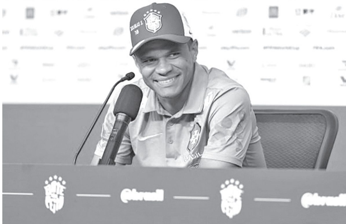
Lateral-esquerdo Douglas Santos comemora a volta à Seleção como titular após nove anos sem vestir a amarelinha