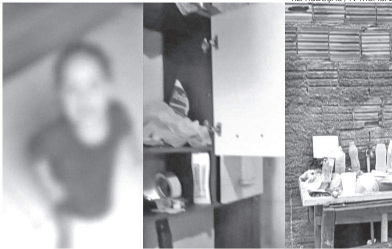
Crianças foram encontradas com fome e se alimentando de lixo no Planalto

O abandono de incapaz é tipificado no Código Penal Brasileiro e ocorre quando uma pessoa responsável deixa alguém sob seus cuidados em situação que coloque em risco sua integridade física ou sua vida. A pena pode ser agravada quando a vítima é menor de idade ou quando o abandono resulta em lesão grave ou morte. ●