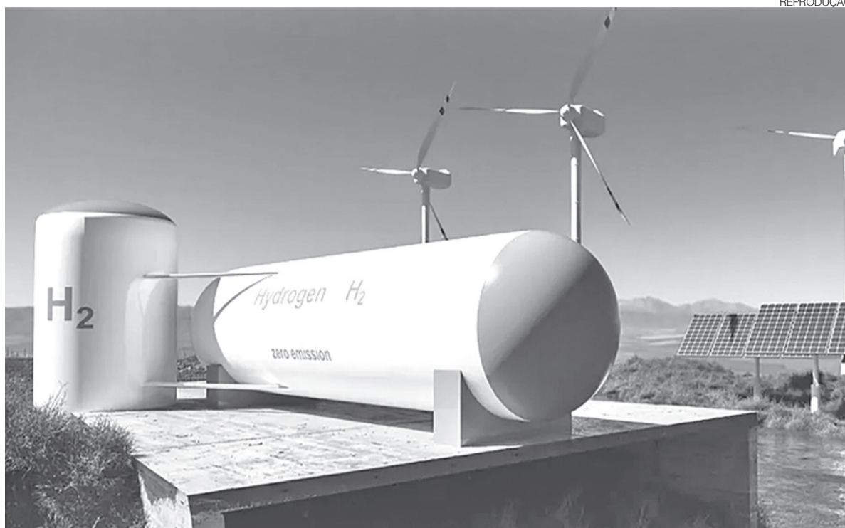
Projeto da UFRN utiliza processos eletroquímicos para transformar rejeitos salinos em hidrogênio verde e hipoclorito

Desenvolvido no Laboratório de Eletroquímica Ambiental e Aplicada (LEAA), o projeto propõe integrar processos eletroquímicos capazes de transformar rejeitos salinos em produtos de maior valor agregado, como hidrogênio verde e hipoclorito. A proposta prevê o aproveitamento de correntes residuais geradas em processos de dessalinização e em atividades industriais, buscando reduzir os impactos ambientais associados ao descarte desses resíduos e contribuir para