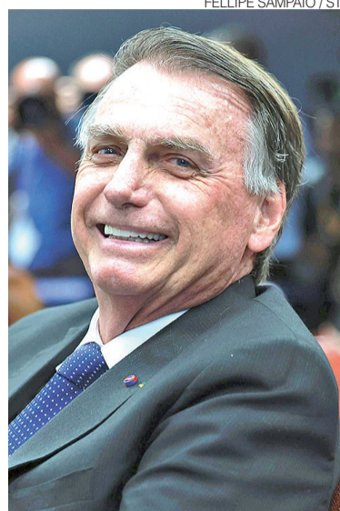
Ex-presidente está condenado por golpe

Antes da decisão desta sexta-feira, não havia qualquer determinação judicial obrigando Bolsonaro a entregar suas armas, cancelar registros ou cumprir restrições relacionadas à posse de armamentos. Após a apreensão da pistola Glock calibre 9 milímetros, Moraes solicitou esclarecimentos à defesa sobre o motivo de o condenado manter uma ar-