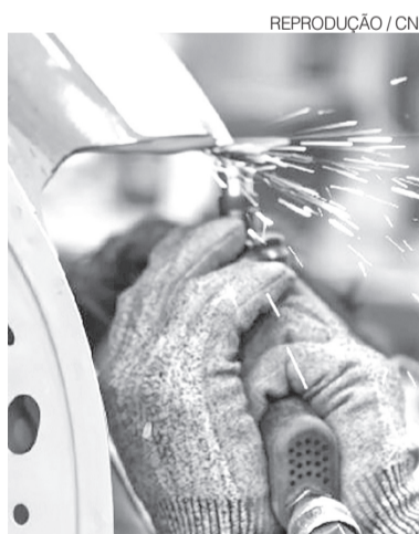
17 segmentos registraram queda

Entre os destaques positivos na comparação anual estiveram os produtos farmoquímicos e farmacêuticos, cuja produção cresceu 13,2%, seguidos pela fabricação de veículos automotores, rebocos e carrocerias, com alta de