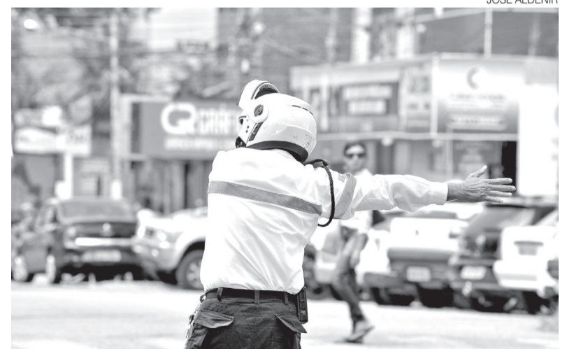
Lei prevê benefícios como Indenização de Transporte de R$ 460 mensais

A lei também prevê benefícios como Indenização de Transporte de R$ 460 mensais, Adicional de Conductor de Viatura, Adicional de Tempo de Serviço, Adicional Noturno e Vantagem Remuneratória de Atividade de Segurança