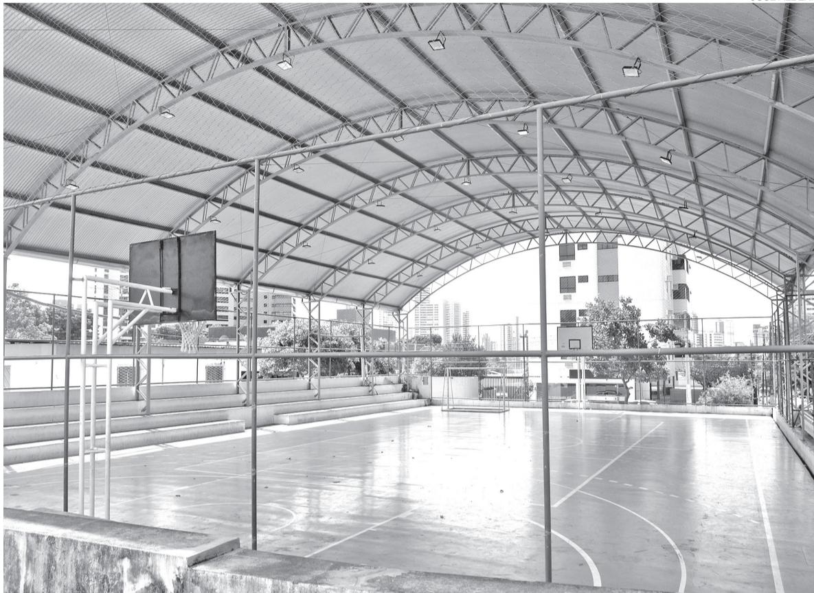
Quadras dos Guarapes e Conjunto Pirangi receberão cobertura e serviços de requalificação para atividades esportivas