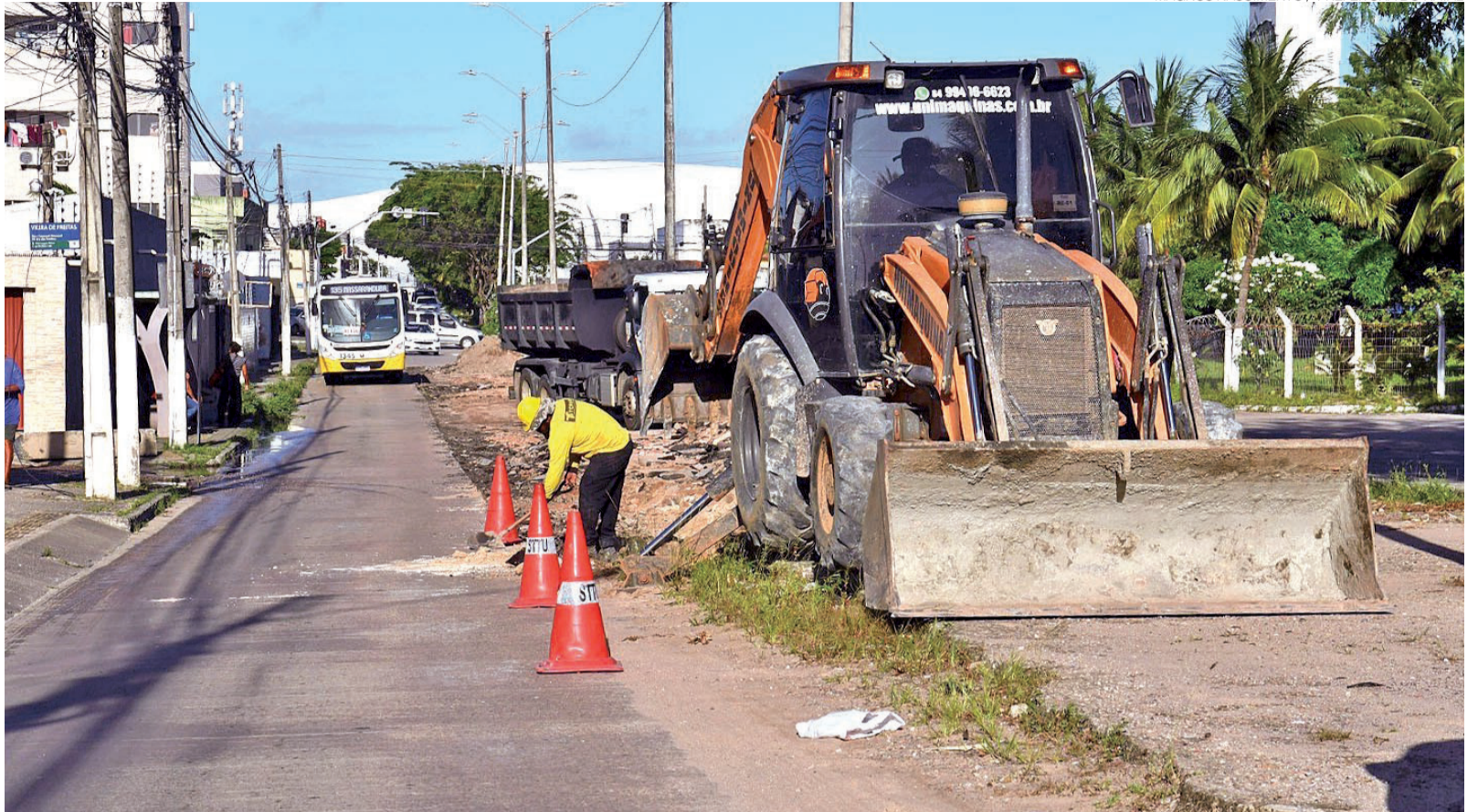
Obras de recuperação da Avenida Jerônimo Câmara já começaram e incluem recapeamento asfáltico, nova sinalização e investimento de R$ 4,3 milhões

Serviços eram esperados havia 12 anos e incluem recapeamento asfáltico de toda a via, garantindo melhores condições de circulação na Zona Oeste de Natal