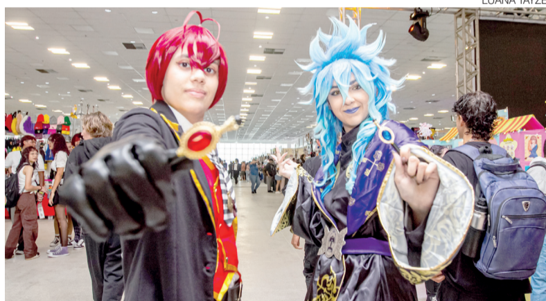
GGCON reuniu mais de 50 mil visitantes durante três dias de programação