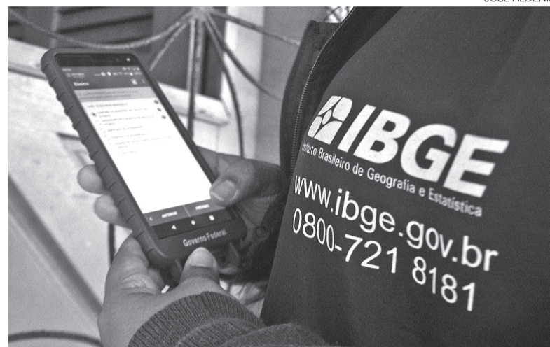
Pesquisador do IBGE em visita a propriedade domiciliar no Rio Grande do Norte

Ao todo, são 99 oportunidades divididas entre cinco funções: Agen-