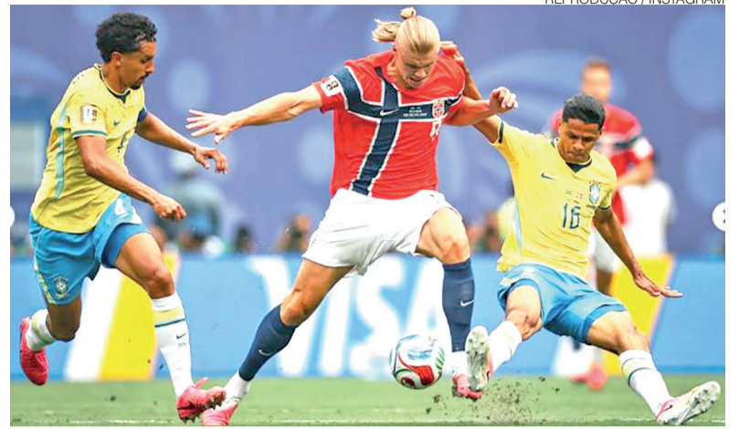
Haaland sendo marcado por dois brasileiros durante jogo que eliminou a seleção

Os pedidos surgiram depois de Haaland marcar os dois gols da vitória que encerrou a campanha brasileira ainda nas oitavas de final, resultado que interrompeu a sequência de classificações do Brasil às quartas de final e ampliou para 28 anos o jejum da se-