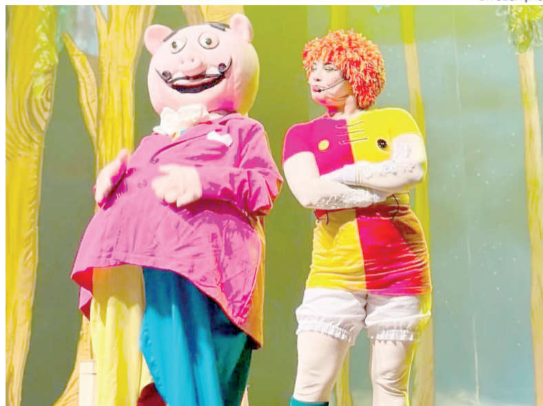
Emília e Rabicó compõem espetáculo infantil que será apresentado domingo

A montagem reúne histórias inspiradas no universo do Sítio do Picapau Amarelo e traz ao palco personagens conhecidos