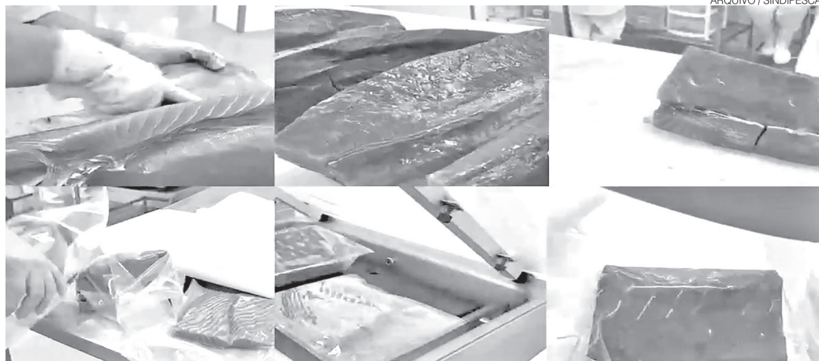
Tipos de cortes de atum exportado ao mercado norte-americano antes do tarifaço imposto pelo presidente Trump

As audiências fazem parte do processo aberto com base na Seção 301 da legislação comercial americana, mecanismo usado pelos Estados Unidos para apurar práticas consideradas prejudiciais ao comércio do país. Nessa etapa, empresas, entidades, governos e demais interessados podem apresentar argumentos antes da decisão final de Washington, prevista para até 15 de julho. Também participam da comitiva empresários ligados à Associação Brasileira da Indústria de Máquinas e Equipamentos (Abimaq), a Confederação da Agricultura e Pecuária do Brasil (CNA), além de setores como café, arroz, açúcar, etanol de milho, ferro-gusa, rochas ornamentais, madeira, papel, calçados, mel e pescados. ●