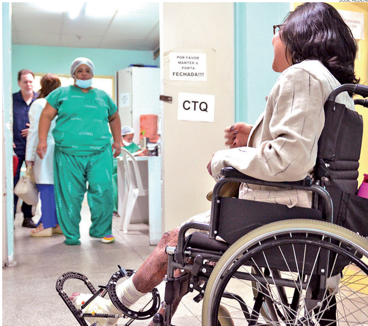
Centro de Tratamento de Queimados do Walfredo Gurgel: MP e DPE querem cronograma da obra em até 90 dias

O CTQ é a única unidade pública habilitada pelo Ministério da Saúde como referência de alta complexidade para tratamento de queimaduras no Estado. O serviço atende pacientes de todos os municípios potiguares, in-