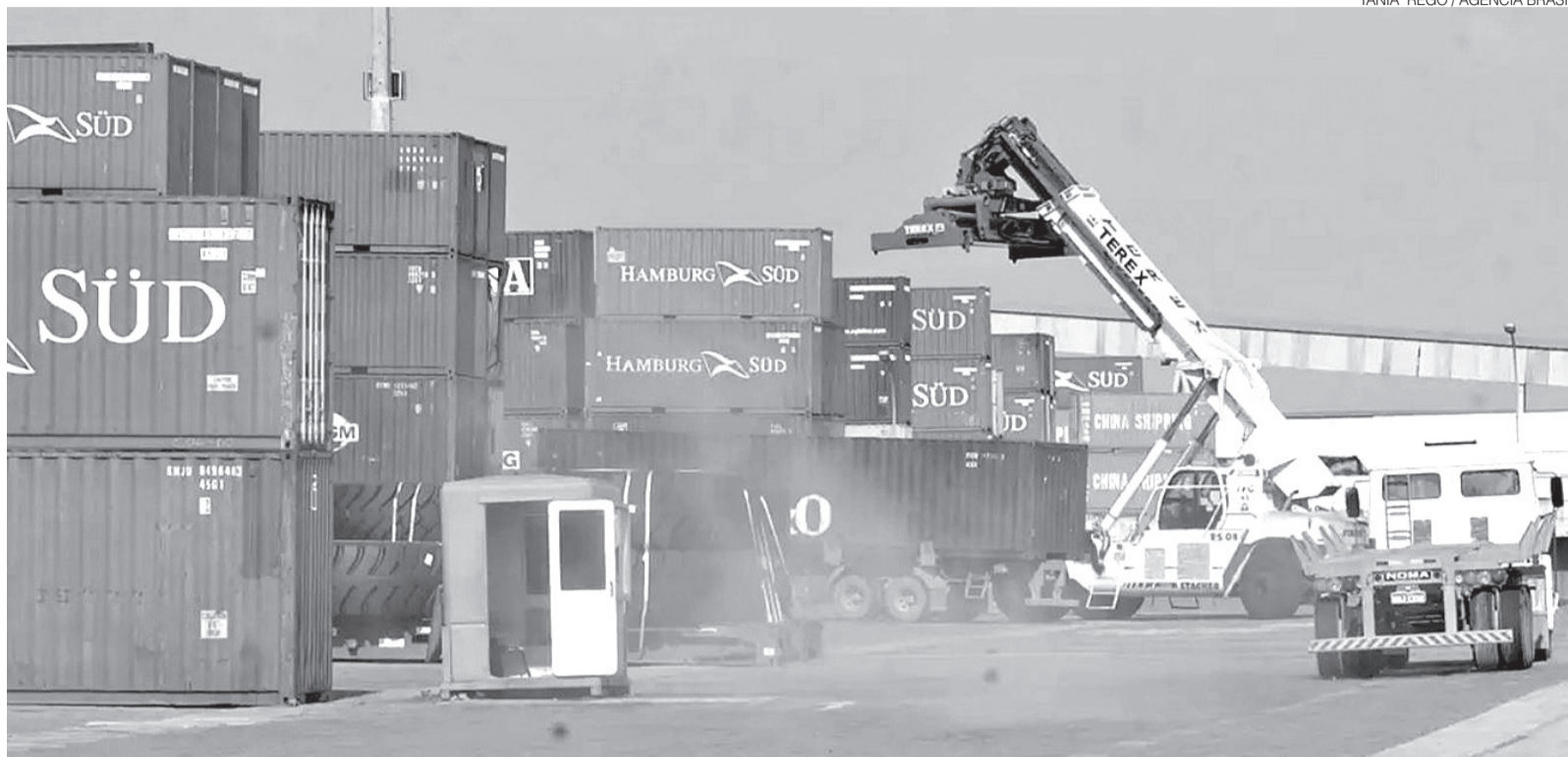
Pela primeira vez desde a imposição do tarifaço, as exportações brasileiras superaram as importações advindas dos Estados Unidos, com superávit de US$ 1 milhão

Apesar da recuperação, o avanço foi sustentado principalmente pelo aumento dos preços médios das mercadorias exportadas. De acordo com o diretor de Estatísticas e Estudos de Comércio Exterior do Mdic, Herlon Brandão, os preços cresceram, em média, 11%, enquanto o volume embarcado para o mercado norte-americano ainda registrou queda de 6,6%. O desempenho permitiu que a corrente de comércio entre os dois países encerrasse junho praticamente equilibrada, com exportações de US$