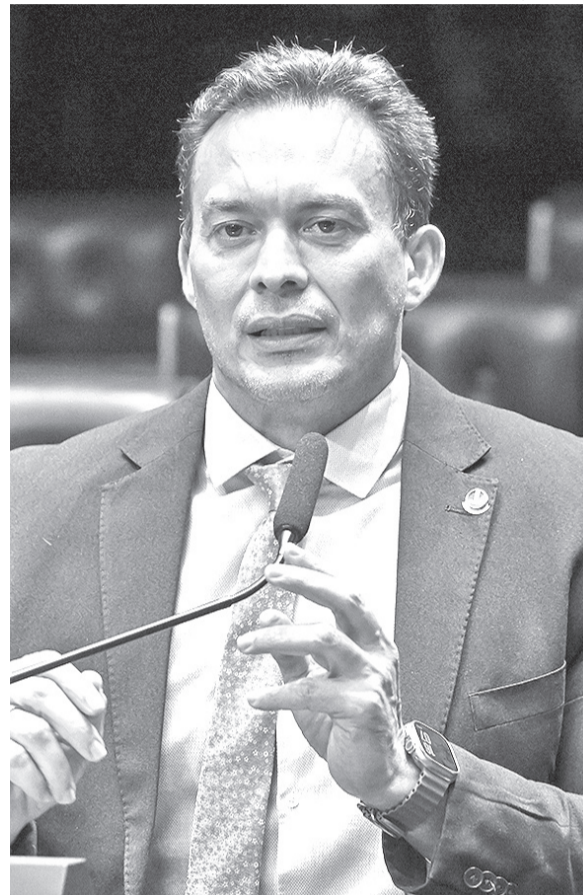
Senador Styvenson Valentim (Podemos) acionou TRE

Podemos assumiu formalmente o polo ativo da ação, medida aceita pela magistrada antes da análise do pedido urgente.