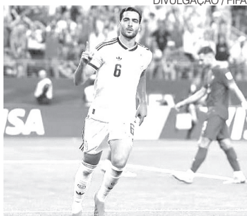
Mikel Merino fez o gol da Espanha

Cristiano Ronaldo encerra sua história em Copas do Mundo com 27 partidas e 11 gols marcados. Nesta edição, anotou seu primeiro gol em fases eliminatórias ao balançar as redes na vitória sobre a Croácia, nos 16-avos de final. Classificada, a Espanha enfrentará nas quartas de final o vencedor do confronto entre Estados Unidos e Bélgica. A partida está marcada para sexta-feira 10, às 16h (horário de Brasília), no SoFi Stadium, em Los Angeles. ●