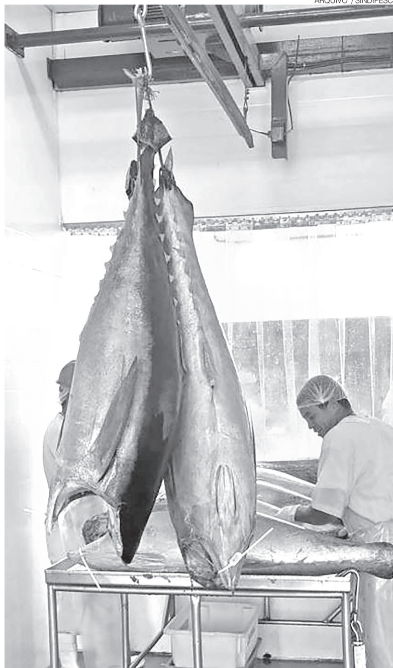
Tratamento do atum pescado na costa litorânea potiguar, produto de exportação