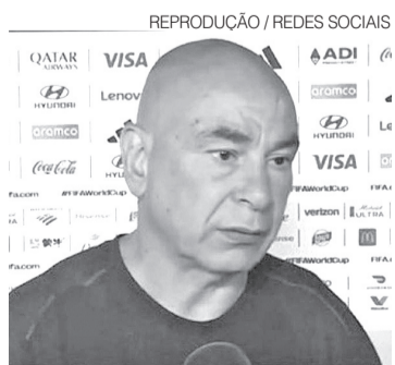
Técnico egípcio não gostou do juiz