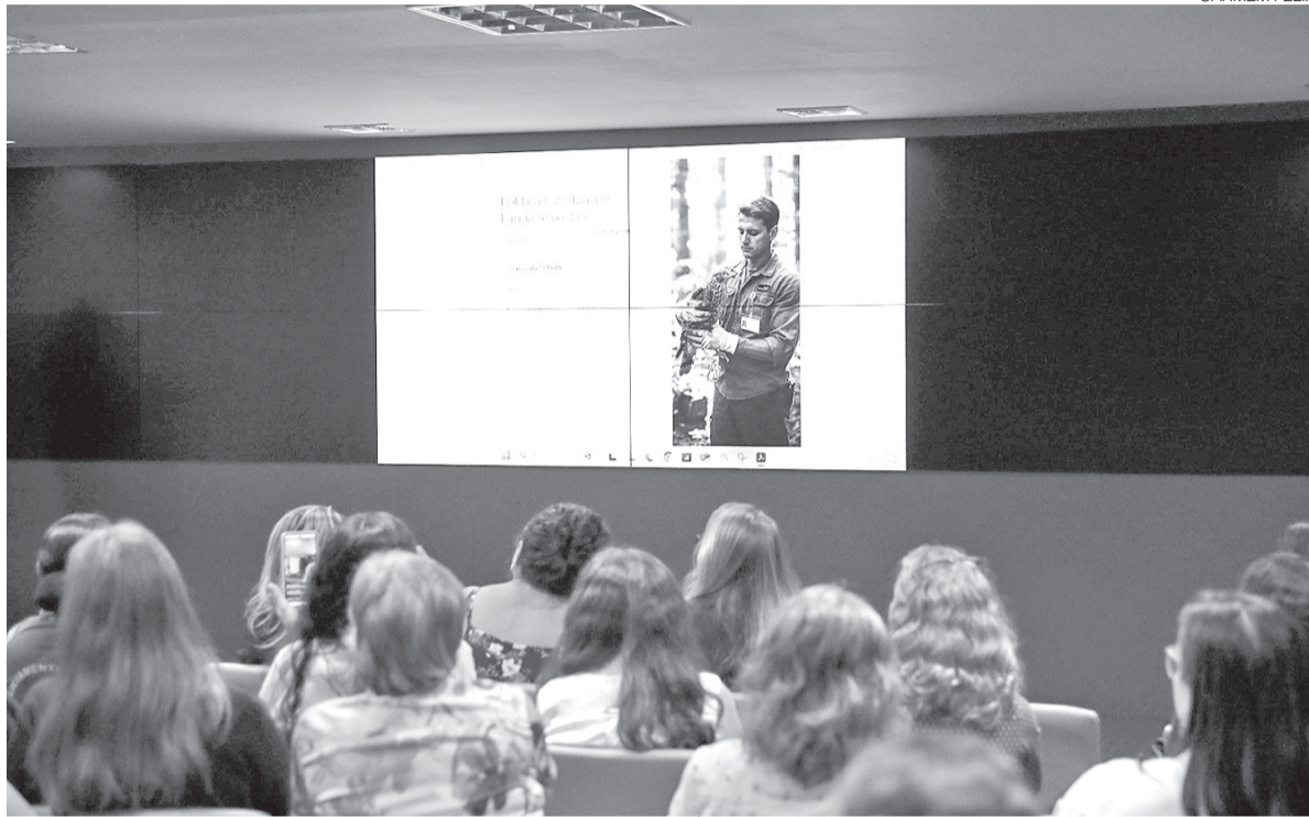
Durante a solenidade, o Governo do Estado apresentou o relatório da Comissão Governamental de Defesa dos Animais

Pelas novas regras, o manejo desses animais deve seguir critérios técnicos, com ações como captura, esterilização, vacinação, identificação e devolução ao local de origem. A proposta busca organizar a atuação do poder público e da sociedade na proteção de animais que vivem em espaços públicos e dependem do cuidado coletivo.