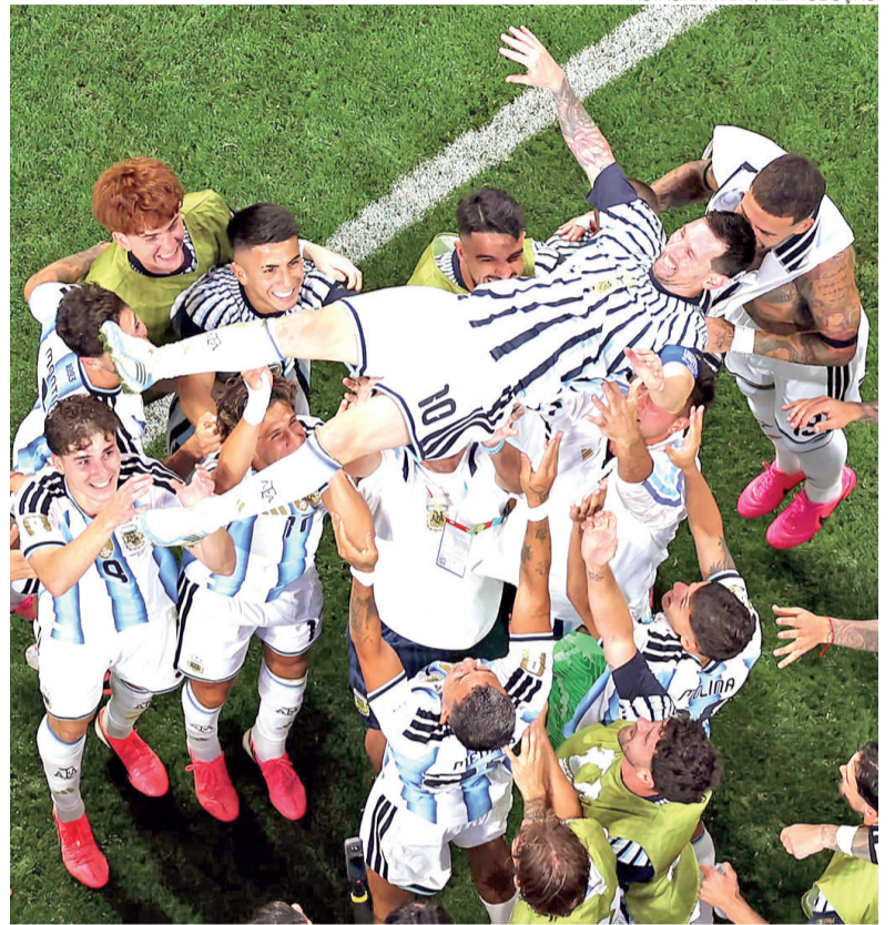
Messi foi ovacionado por colegas de seleção após vitória contra egípcios

Para a Argentina, a classificação mantém viva a possibilidade de conquistar o bicampeonato consecutivo e reforça o protagonismo de Messi na competição. A equipe chegou às quartas de final após uma campanha marcada por 100% de aproveitamento na fase de grupos e duas classificações construídas com dificuldades no mata-mata, primeiro diante de Cabo Verde e agora contra o Egito. O desempenho evidencia a capacidade de reação da equipe, mas também expõe fragilidades defensivas que deverão exigir ajustes para a sequência do torneio. ●