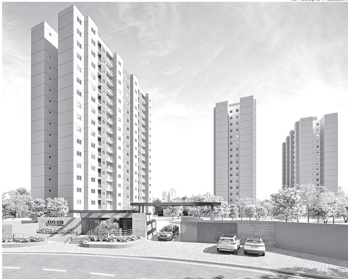
Projeto do empreendimento Única Veredas, localizado na Avenida Ayrton Senna, entre Neópolis e Ponta Negra

O levantamento mostra ainda que os apartamentos de dois quartos representam 65,7% da oferta disponível na capital, enquanto os empreendimentos econômicos concentram 43,3% do estoque imobiliário, evidenciando a predominância de projetos destinados à classe média e às famílias que buscam adquirir a primeira moradia. Neópolis concentrou quase 60% dos lançamentos registrados no trimestre, consolidando-se como principal vetor de expansão imobiliária da cidade, ao lado de bairros como Petrópolis, Tirol, Areia Preta, Nossa Se-