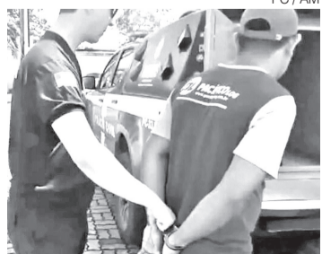
Suspeito do RN é preso em Manaus