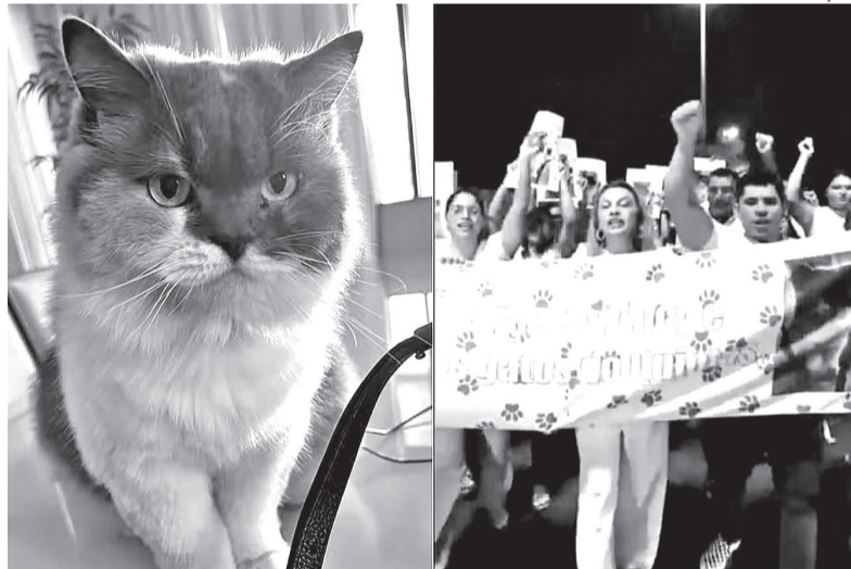
Protesto pediu investigação e justiça após morte de gata capturada em Mossoró

Segundo o secretário, a legislação também busca enfrentar o crescimento da população de animais abandonados por meio de políticas de castração. “Se a gente não tiver como controlar através da castração, seja de animais do sexo masculino ou feminino, você pode proliferar muita quantidade de animais soltos e isso passa a ser