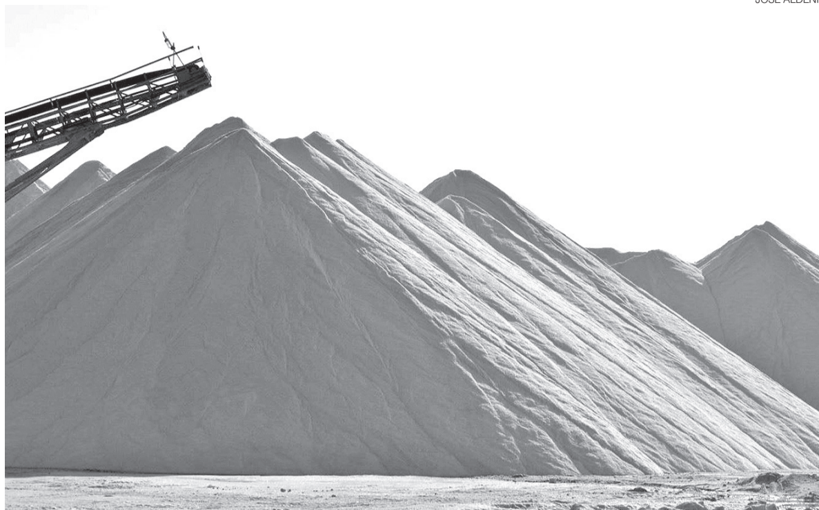
RN tem a chance de agregar maior valor produtivo com a produção de baterias ions de sódio, com nova tecnologia

O Rio Grande do Norte reúne vantagens naturais para participar desse movimento. Além de concentrar praticamente toda a produção nacional de sal marinho, o setor representa uma das principais atividades industriais do Estado, gerando cerca de 15 mil empregos diretos e mais de 50 mil indiretos. A cadeia salineira abastece a indústria química brasileira, o tratamento de água, a alimentação, a pecuária e man-