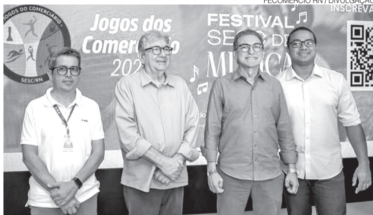
Dirigentes do Sistema Fecomércio durante cerimônia de lançamento ontem

Competição esportiva deve reunir quase 4 mil atletas em 12 modalidades, enquanto festival volta ao calendário com etapas em Natal, Mossoró e Caicó