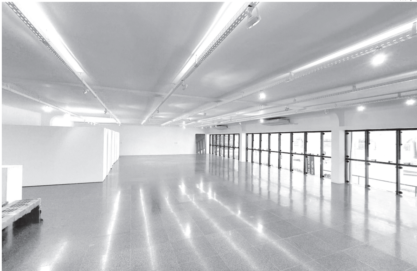
Galeria Newton Navarro reabre nesta quinta-feira 9 com a exposição “Paisagens inquietas em Newton Navarro”, que reúne cerca de 60 obras do artista potiguar

Reconhecido como um dos principais nomes da arte moderna no Rio Grande do Norte, Newton Navarro teve atuação como pintor, desenhista, escritor, dramaturgo, cronista e incentivador da cultura potiguar.