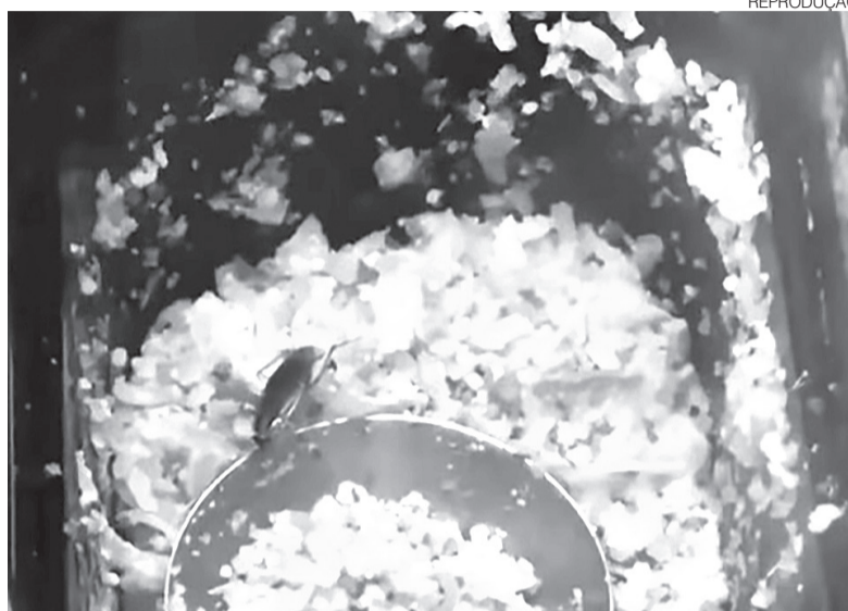
Denúncia levou Procon Natal a fiscalizar unidade do Subway por causa de barata

Ela afirmou que a participação dos consumidores é funda-