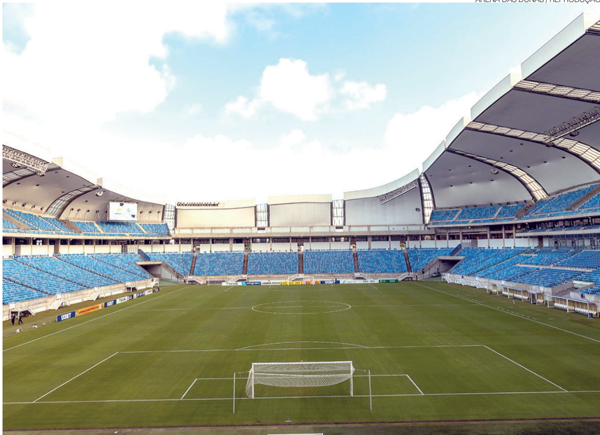
Partidas decisivas acontecem neste domingo e na segunda-feira, valendo vagas nas oitavas de final da competição