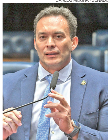
Senador Styvenson Valentim (Podemos)

Samanda também procurou relativizar a associação exclusiva entre a figura do parlamentar e os recursos destinados por emendas. Segundo ela, o dinheiro executado depende da existência de políticas e dotações no planejamento federal. “Até porque os recursos das emendas são recursos