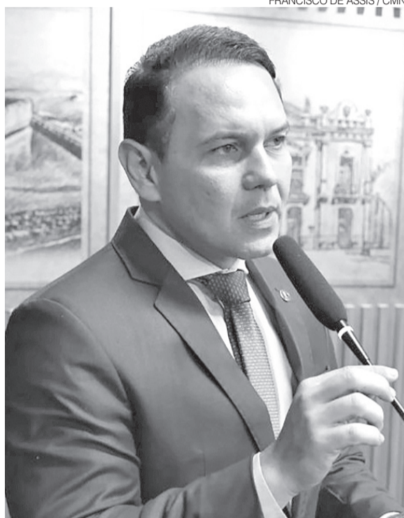
Vereador de Natal apoia Álvaro para o Governo do RN

“Álvaro Dias é o fim do mundo. É um candidato despreparado, um candidato que não tem compromisso com o Rio Grande do Norte, não tem compromisso com a honestidade da administração pública. Ele nunca se preocupou com isso. Ele enganou durante muito tempo. É um erro