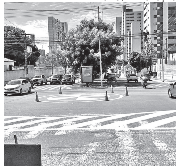
Cruzamento com a Rodrigues Alves