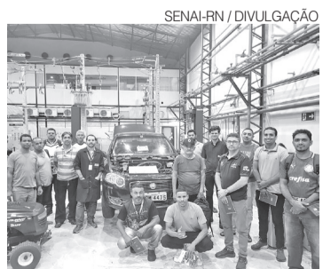
Aulas vão acontecer no CTGAS-ER

Informações podem ser obtidas pelo e-mail secretariatal@rn.senai.br, pelo WhatsApp (84) 3204-8114 ou no portal Futuro.Digital do Senai-RN.