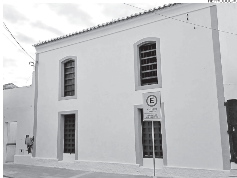
Museu do Seridó recebeu o prédio histórico após a conclusão da restauração

Localizado em Caicó, o Museu do Seridó é um dos principais equipamentos culturais da região e reúne objetos, documentos e peças que registram aspectos históricos, religiosos e sociais da formação do Seridó potiguar. ●