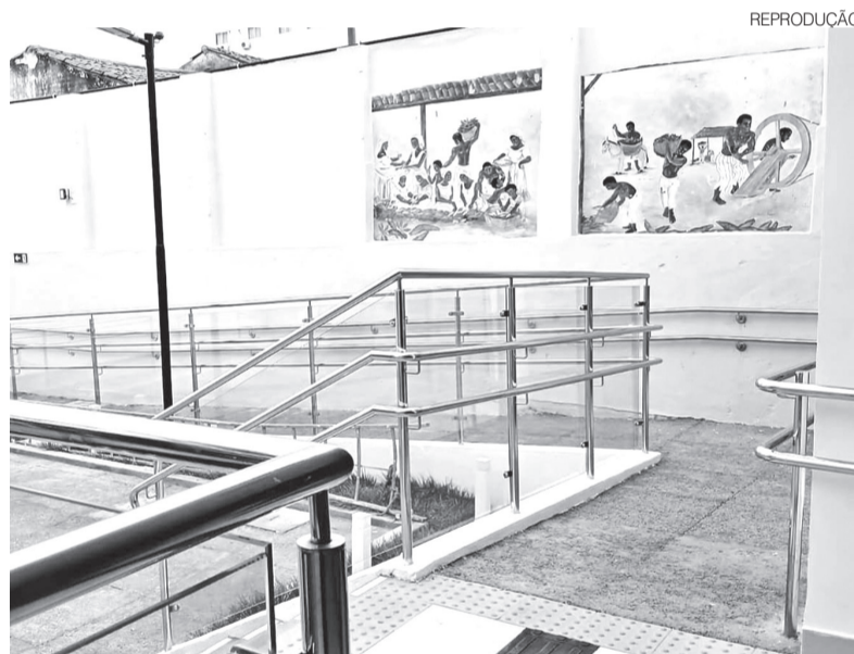
Acervo abriga vestimentas, documentos históricos e objetos de arte sacra