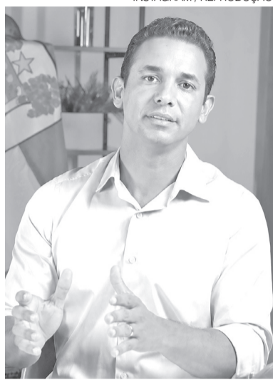
Ex-prefeito de Mossoró Allyson Bezerra