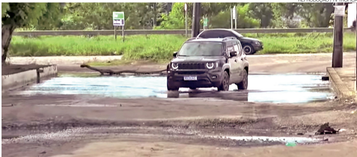
Lagoa formada sobre a pista dificulta a passagem de veículos; motoristas e motociclistas chegam a utilizar a calçada

Outro problema apontado é a poeira levantada pelo trá-