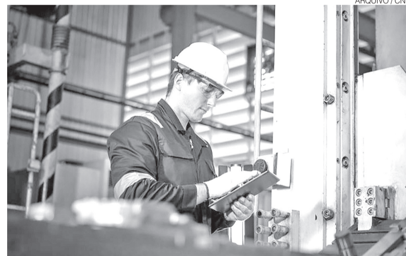
CNI destaca que cenário industrial nacional mantém cenário de estabilidade

O mercado de trabalho industrial apresentou sinais mistos. O emprego cresceu 0,5% em maio,