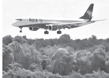
Menores viajarão ao lado dos pais