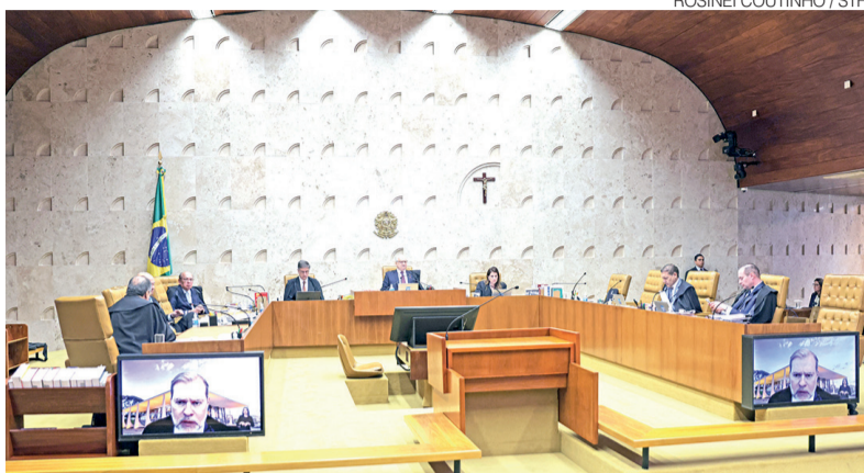
Plenário do Supremo Tribunal Federal durante julgamento nesta semana

O julgamento analisou ações apresentadas pela Rede Sustentabilidade, pela Federação Nacional das Associações Quilombolas e pela Procuradoria-Geral da República (PGR) contra dispositivos da Emenda Constitucional 133, promulgada em agosto de 2024. Os autores sustentavam que a fixação do piso de 30% representava retrocesso em relação às políticas afirmativas eleitorais e também questionavam o mecanismo de compensação criado para parti-