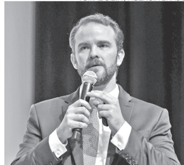
Ministro da Fazenda, Dario Durigan

tes, com atenção especial às redes sociais. O Ministério da Justiça já abriu processo para apurar eventual publicidade abusiva da CazéTV relacionada à divulgação de promoções de bets durante transmissões da Copa do Mundo de 2026.