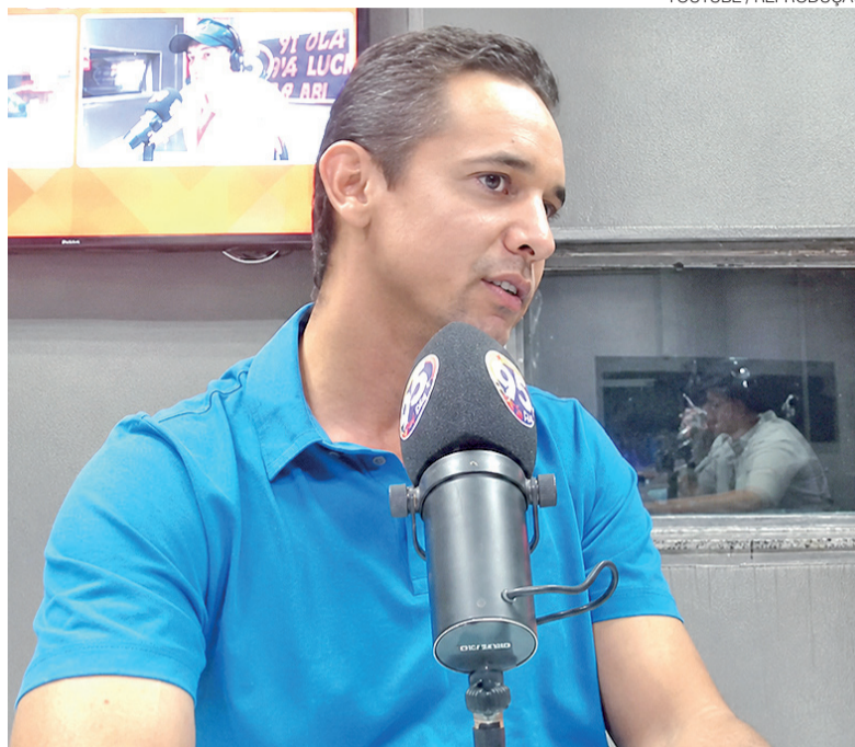
Ex-prefeito de Mossoró durante entrevista à rádio 95 FM nesta quinta-feira 9

O pré-candidato afirmou que pretende adotar no Governo do Estado uma postura semelhante à que empregou em Mossoró, rejeitando a responsabilização permanente de administrações anteriores pelos problemas atu-