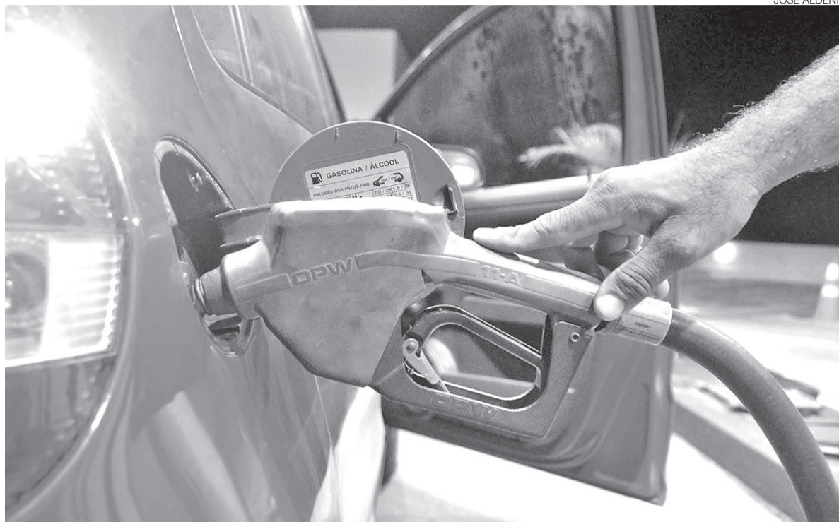
Na gasolina, o aumento em uma semana foi de R$ 0,11 e no óleo diesel a elevação foi de R$ 0,10 por cada litro

Na gasolina A, o litro passou de R$ 3,80, valor praticado desde 2 de julho, para R$ 3,86, um acréscimo de R$ 0,06 por litro. Na atualização anterior, anunciada na semana passada, o combustível já havia sido reajustado de R$ 3,75 para R$ 3,80, alta de R$ 0,05.