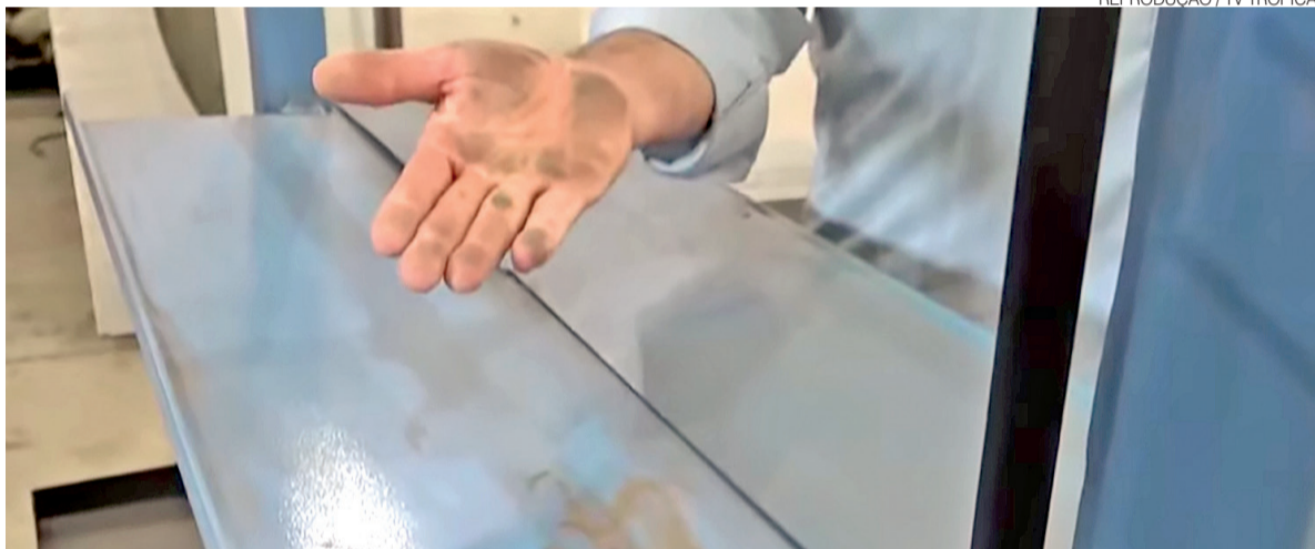
Para minimizar os impactos da poeira no bairro, funcionários passaram a utilizar máscaras ao longo do expediente

fego. Conforme os relatos, um empresário instalou dois tonéis com uma bomba de construção para molhar constantemente a pista, na tentativa de evitar que a poeira entre no estabelecimento. Ainda segundo os denunciantes, a medida é necessária porque o vento espalha o material para o interior da empresa.