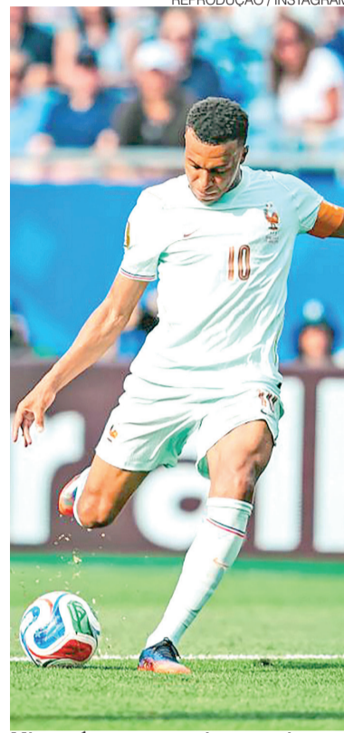
Mbappé marcou mais um golazo

A França controlou o confronto desde os primeiros minutos ao pressionar a saída de bola do Marrocos e explorar a velocidade pelos lados do campo. No setor ofensivo, Kylian Mbappé voltou a ser o principal desequilíbrio. Com liberdade para flutuar entre o centro e a esquerda, atraiu a marcação marroquina e abriu espaços para as infiltrações dos companheiros. Ousmane Dembélé