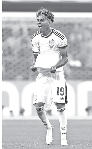
Yamal é a esperança da Espanha