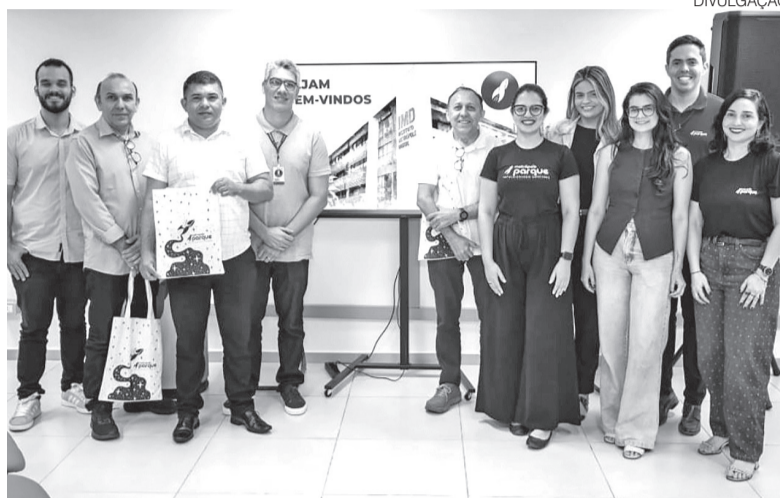
São sete novas empresas, ampliando para 54 o total de startups na UFRN

Também passaram a integrar o programa a AutonomIA, empresa de Brasília especializada em educação em tecnologia