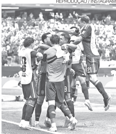
Jogadores da Espanha em festa

Seleção espanhola vence a Bélgica por 2 a 1 com gol no fim, mantém campanha consistente na Copa da Fifa e enfrentará a França por uma vaga na decisão