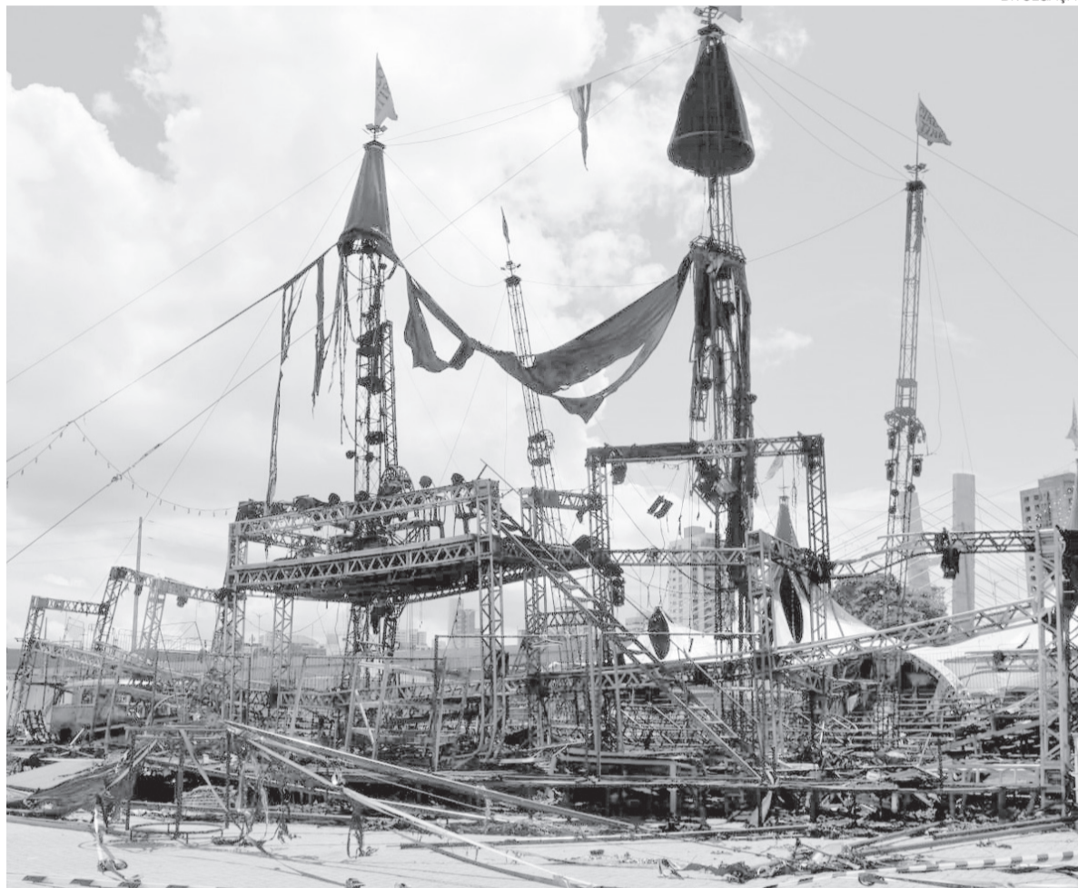
Laudo da Polícia Científica aponta que o incêndio no Circo do Tirú teve, como hipótese mais provável, origem elétrica

Conforme o laudo, os indícios mais consistentes sobre a origem do incêndio estavam concentrados em uma área da estrutura voltada para a Arena das Dunas, onde estavam instalados equipamentos eletrônicos, fiação e estruturas utilizadas para iluminação, sonorização e painel de LED.