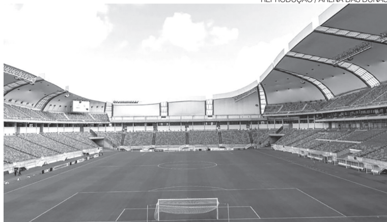
Previsão de estádio lotado para os próximos confrontos de ABC e América