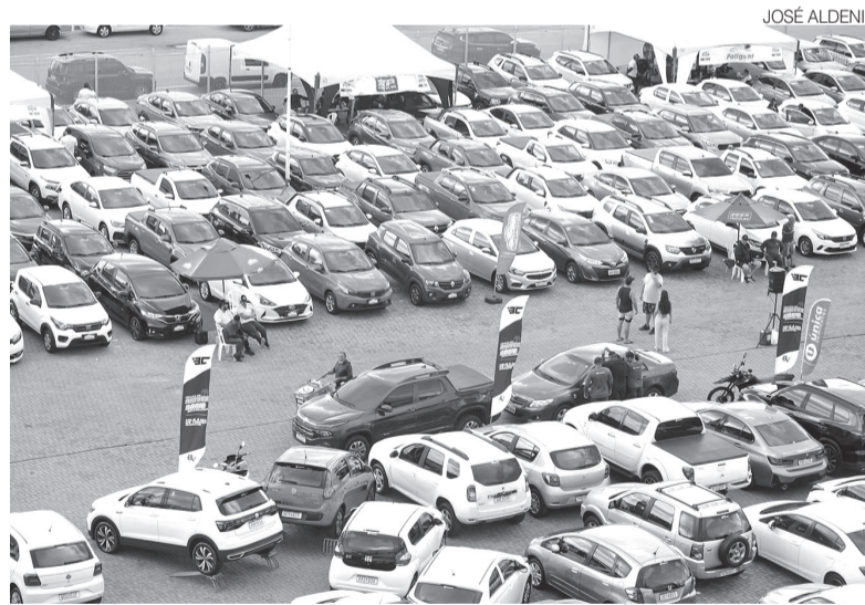
Levantamento realizado pelo Sincodiv-RN mostra expansão na venda de carros

No Rio Grande do Norte, as motocicletas continuaram liderando as vendas. O segmento respondeu por 21.191 emplacamentos no primeiro semestre, alta de 16,7% em relação às 18.148 unidades comercializadas entre janeiro e junho de 2025. Os automóveis apresentaram o maior avanço proporcional, com crescimento de 29,1%, passando de 8.030 para 10.369