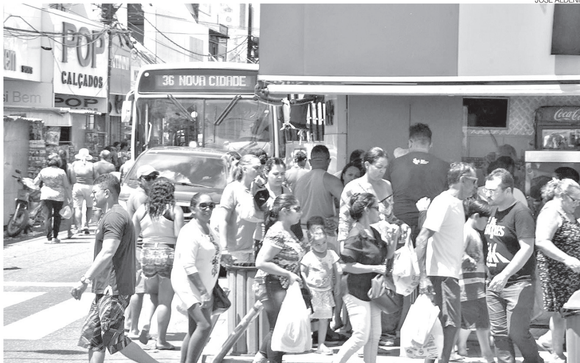
Iniciativa da Prefeitura do Natal busca dinamizar o transporte coletivo para o Alecrim e Centro e tem apoio do comércio

Criado em abril deste ano, o programa concede o benefício aos usuários que realizarem dois embarques no mesmo dia utilizando o cartão de bilhetagem Nubus. O primeiro embarque