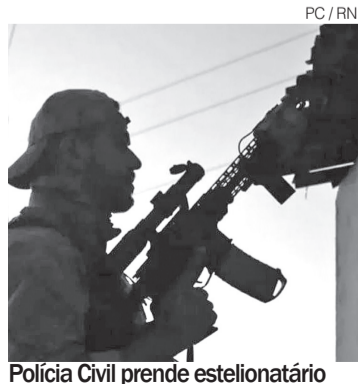
PC/RN Polícia Civil prende estelionatário

A corporação orienta a população, principalmente pessoas idosas, a não fornecer dados pessoais ou bancários por telefone, aplicativos de mensagens ou redes sociais sem confirmar a identidade do solicitante. A Polícia Civil também recomenda que vítimas de fraudes comuniquem imediatamente o crime às autoridades, permitindo uma resposta mais rápida das equipes de investigação e aumentando as chances de identificação dos responsáveis. ●