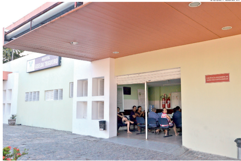
De acordo com sindicato, problema atinge a região da enfermaria do hospital

Imagens mostram pombos circulando nas áreas externas do hospital e, segundo o sindicato, também dentro da enfermaria. A dire-