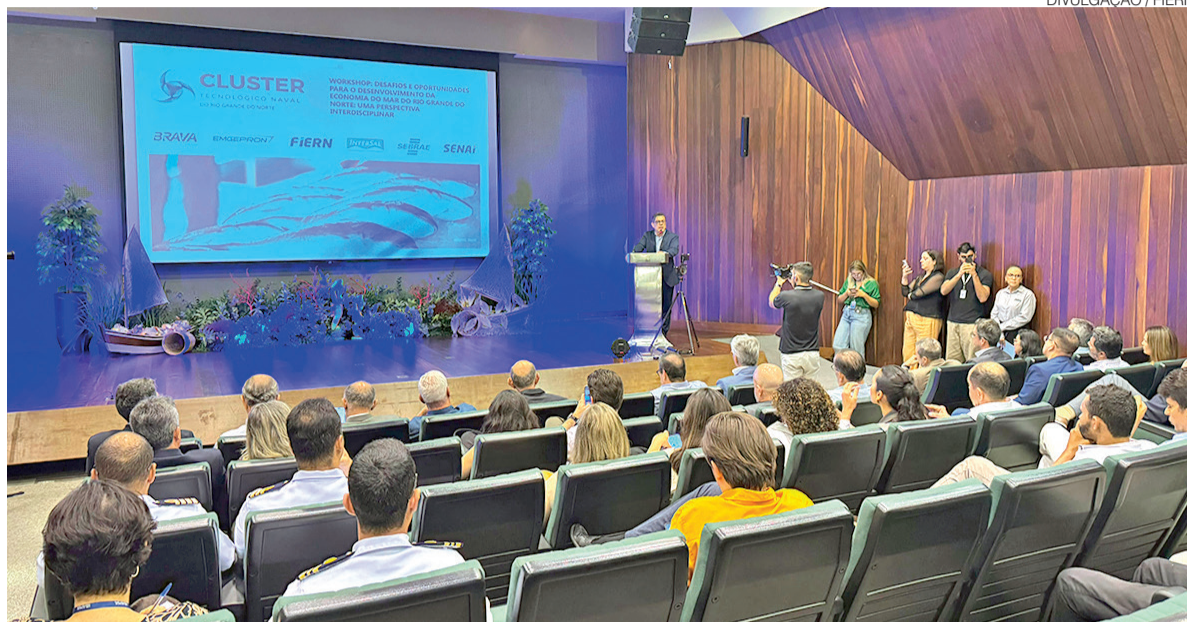
Evento reuniu representantes do setor produtivo e gestores públicos para discutir potencial da economia do mar no RN