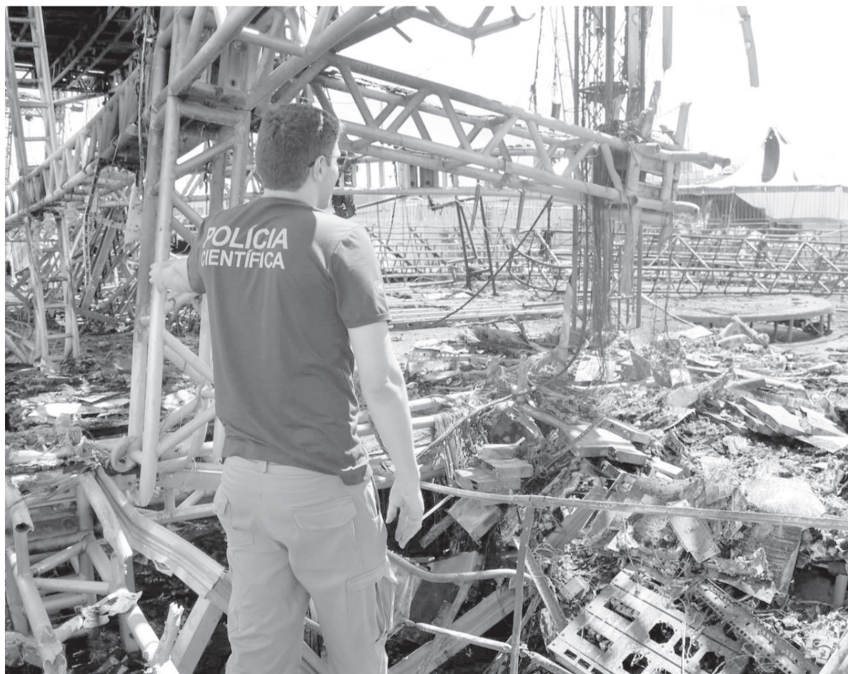
Perícia analisou vestígios, imagens de videomonitoramento e informações técnicas para identificar origem das chamas

Segundo a PCIRN, as imagens de videomonitoramento foram fundamentais para a conclusão da perícia. Os registros mostram que as chamas tiveram início na região apon-