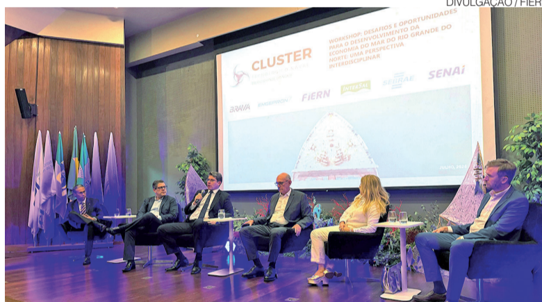
Especialistas apresentaram experiências atuais sobre transição energética

Promovido pela FIERN, Sebrae-RN, SENAI-RN, Emgepron, Brava Energia e Intermarítima, com apoio da Universidade de Coimbra, o workshop lançou os olhares para o potencial econômico das atividades ligadas ao mar, como a indústria naval, a logística portuária, a pesca, as energias renováveis offshore, a inova-