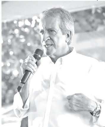
Presidente do PL, Valdemar C. Neto